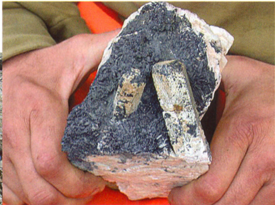
Bavenitt på turmalin fra Li-bruddet, Iveland.