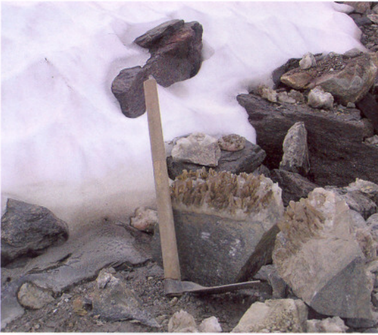
Gode løsblokker lå inntil fonna.