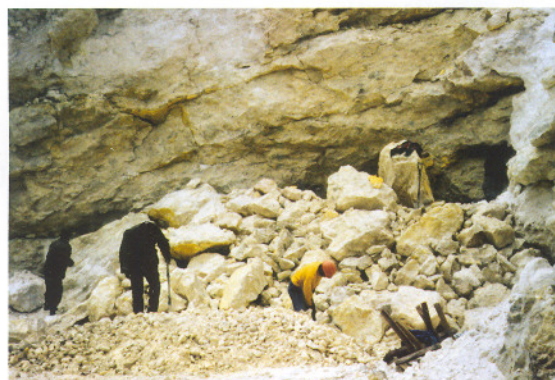
Udvinning af svovl til industri formål er hårdt håndarbejde.