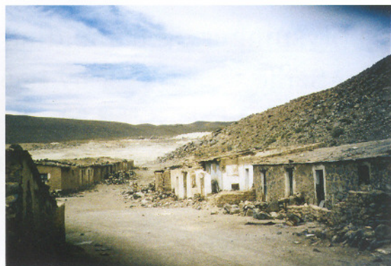
Del af bygningskomplekset i El Desierto.