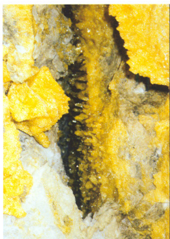
Druse i tuff med Svovl krystaller til 3 cm i El Desierto, Cerro Picoloro, Provincia Daniel Campos, Departamento de Potosi, Bolivia.