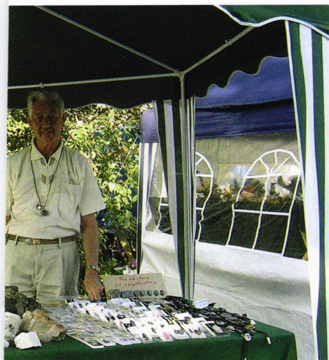
ting et vakkert landskap i cabochon til mønstre.