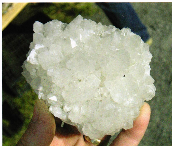
Vakker kvartsgruppe fra Finnmark.

og omegn geologiforening og Vestfold Geologiforening hadde info om sine lokale aktiviteter. At infotellet nå hadde fått en så god plassering ved innganget til messeplassen gjorde at svært mange av de som kom, stoppet opp og skrev seg inn i lodd-boken. Denne lodd-boken gir også en god pekepinn på hvor mange som besøker messen de forskjellige dagene, og overraskelsen var stor da vi så at det var like mange besøkende på søndag som det var på