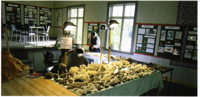
Innendørs, - Rumenerne pakker ut.