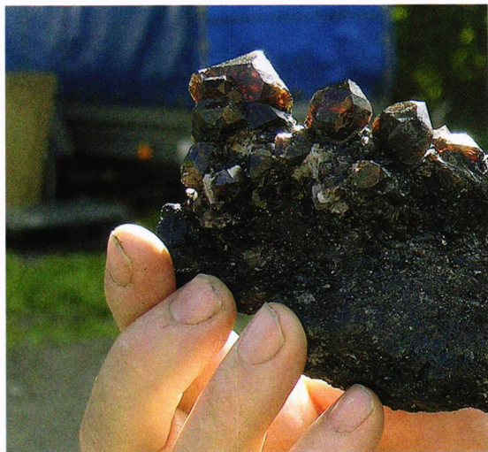
Jo, - zirkonen fra Seiland i Finnmark må være verda

og omegn geologiforening og Vestfold Geologiforening hadde info om sine lokale aktiviteter. At infotellet nå hadde fått en så god plassering ved innganget til messeplassen gjorde at svært mange av de som kom, stoppet opp og skrev seg inn i lodd-boken. Denne lodd-boken gir også en god pekepinn på hvor mange som besøker messen de forskjellige dagene, og overraskelsen var stor da vi så at det var like mange besøkende på søndag som det var på