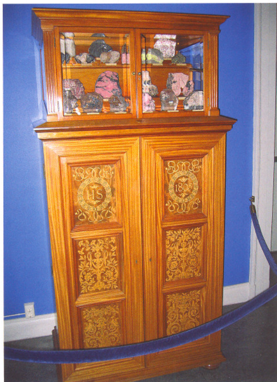
Et av de originale skapene som rommer Hjalmar Sjögrens samling, i NHRs mineralutstilling.