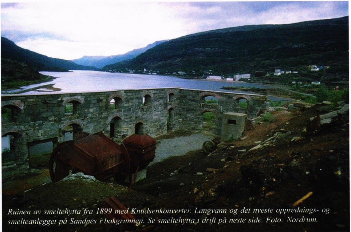
Ruinen av smeltehytta fra 1899 med Knudsenkonverter. Langvann og det nyeste opprednings- og smelteanlegget på Sandnes i bakgrunnen. Se smeltehytta i drift på neste side.

Sulitjelmamasamfunnet er et eneste, stort bergverkskulturminne, omgitt av praktfull natur. Det er fine bygningsmiljøer på Jakobsbakken, Fagerli, Sandnes, Furulund, Glastunes, Bursimarka og Grønli. På Sandnes ligger driftsbygningene fra nyere tid, med blant annet vaskeriet, silo, knuser, flotasjonsbygning, smeltehytte fra 1929 og verkstedbygg. På Furulund ligger blant annet administrasjonsbygninger og bygninger med sosiale funksjoner i tillegg til funksjonær- og arbeiderboliger.