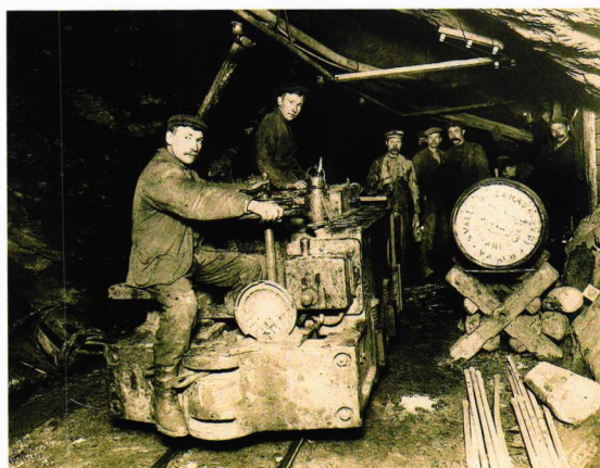
Elektrisk lokomotiv til transport av malm fra 1908.