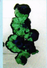
Skive af Azurit og Malakit fra Morenci, Arizona. 49er Minerals stykke.