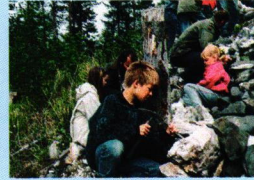
Steinklubben på Grua ved forrige jubileum