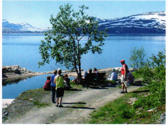
Storakersvatn. Enda skuggan i värmen var en björk.