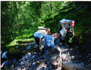
Granatfyndigheten i Fauske