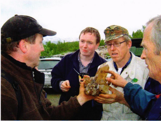
Man beundrar ett fynd, Bardu.