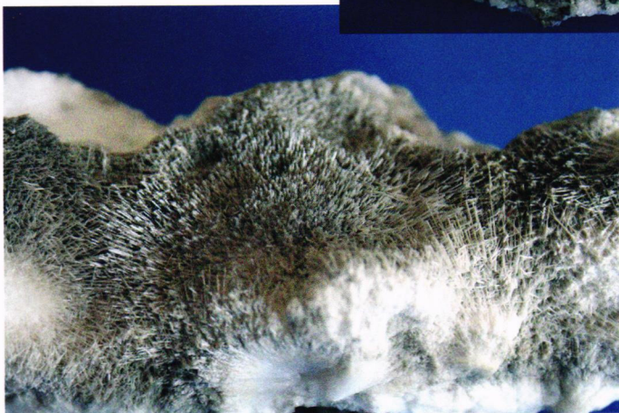
Natrolitt fra Vestmanna ca 15 cm.

for å nyte litt gammel, norrøn kultur. En mindre vakker beskyttelseskappe over de gamle kirkemurene tar litt av andektigheten stedet burde ha gitt. Like i nærheten ligger fergeleiet Gamlaeett, og her skal vi