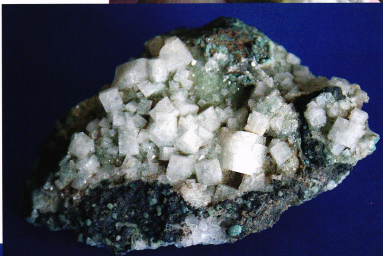
Chabasitt fra Gamlaeett ca 10 cm.

En hyggelig piknik blir det tid til denne fredagen, som for øvrig blir vår eneste dag med godvær. Vi spiser maten vår på stranden ved Leynar, en strand som påstås å ha blitt returnert av havet etter at den hadde vært borte i 90 år. Et idyllisk sted med små kuler av kalsedon i bergveggen. Etter innsjekking på Hotell Føroyar drar vi til Kirkjubøur