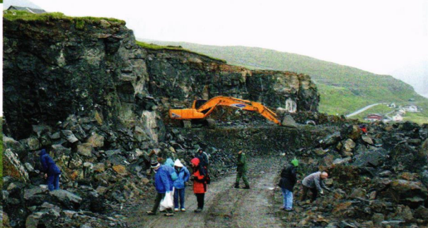
Nytt, spennende steinbrudd på Eysturoy.

Vi skal bo på flyplassøyen Vágur de 2 første nettene. Her vet vi at det bygges en ny tunnel til Gásadalur og denne blir vårt første mål. Vi våger oss i første omgang ikke inn i tunnelen, men går friskt løs på tippmassene og finner en masse småtterier som