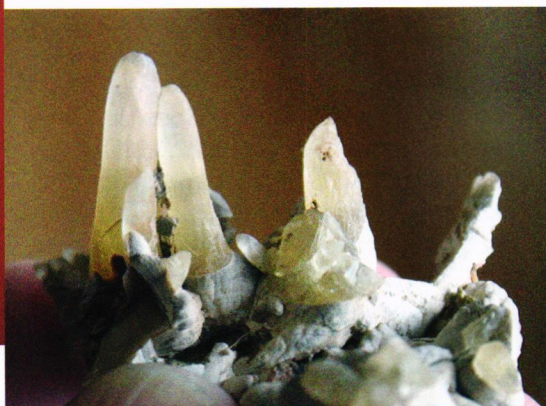
Under: Kalkspat fra Gamlaeett

store stuffer. Bergveggen er temmelig overgrodd og skitten, men hva så? Hjemme har vi vann og diverse rensmidler. Vi får se.