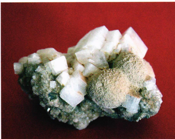
Til venstre: Chabasitt med natrolitt(?) fra Gamlaeett.