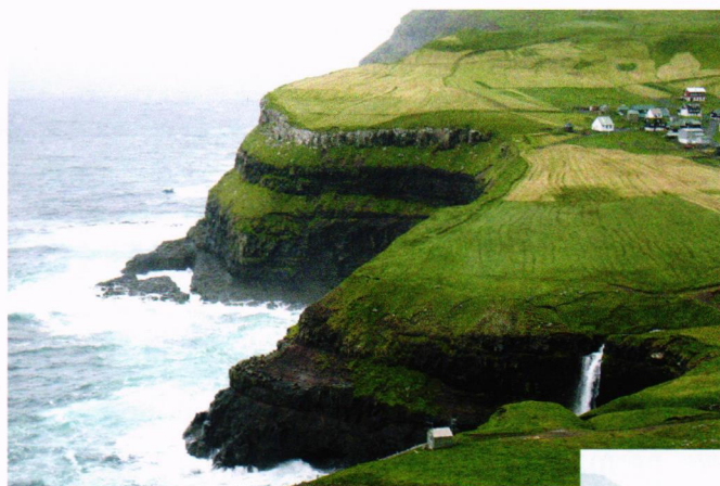
Gásadalur med 16 innbyggere og tøff natur.