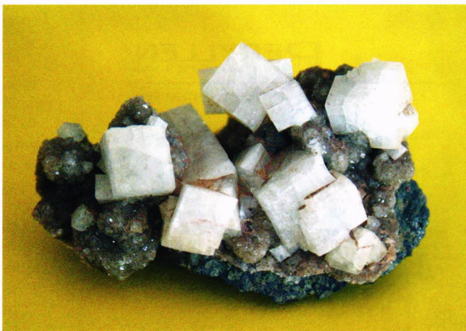
Chabasitt fra Gamlaætt ca 6 cm.