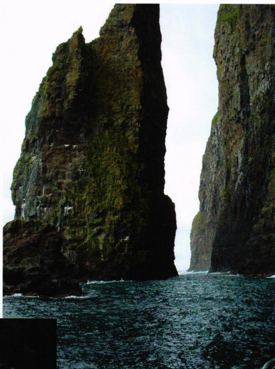
Skjærgården ved Vestmannabjörgini.

Seilingstid fra Bergen inklusive en kort stopp på Shetland er 24 timer.