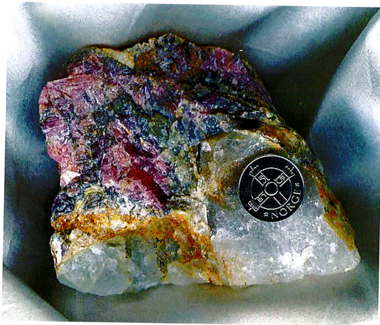
Värynenitt, med andre Be-fosfater, Viitaniemi, Finland, 11 x 8 cm.