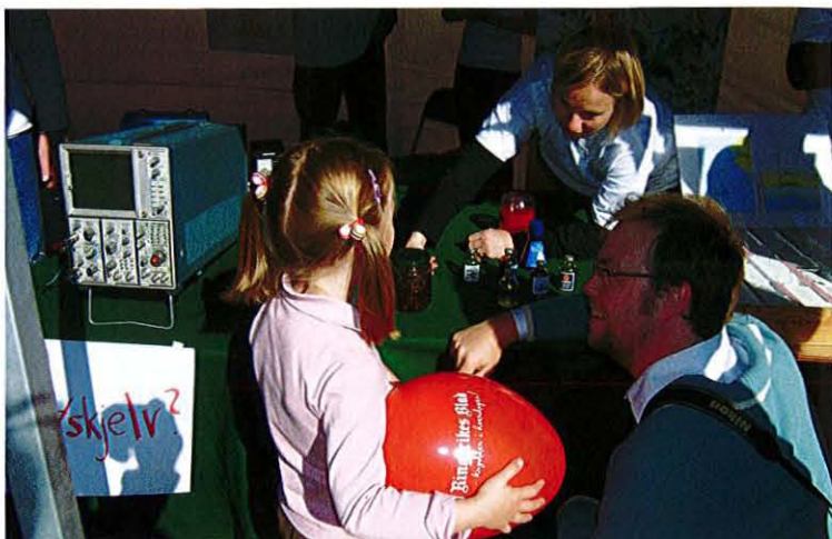
Det er viktig - å få en forklaring når pappa ikke kan gi den. *

.... - å være gode venner med museer så museene og du selv ikke blir ensomme. Også alle steinene, dyra, blomstene og de fine utstillingene som