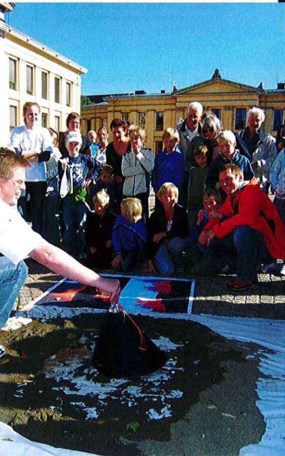
l nå til før utbruddet kommer! Hva er det hører til hva? Og hva trengs hvis vi skal lage? Og hva er syre og hvordan virker den på ulike steiner? *****

arrangementene i forbindelse Geologiens dag 2007. På god stemning. Mye livsfrisk entusiasme omkring faget og rikum bredden i geofagene. Og så så fint vær som det var! ert god oppsluning i år og at det kan bli ny publikumsrekord.