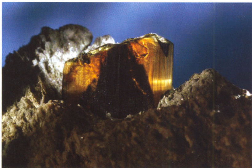
Fig. 1 Brookitt (11x12 mm) fra Nibbenut donert av Jørn Hurum.

-Torgeir T. Garmo har donert flere 10 talls prøver med referanse prøver fra lokaliteter som museet man-