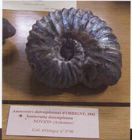
Ammonites dutempleanus d'ORBIGNY, 1841 → Sonneratia dutempleana NOVION (Ardennes) Coll. d'Orbigny n° 5796

godt humør, pensler og konserveringsmiddel drev Luc Vives og Delphine Chapsal på likevel. Dyra skal holdes i god trim! Og så var det annen etasje. Her var det både dinosaurmodeller og ammonitter (den på bildet, høyre synes å være pyritisert og den til venstre har fine kvartskrystaller