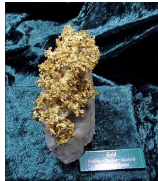
Av utstillingene var gullet fra Aostadalen i Italia oppsiktsvekkende. I de gamle gruvene som Kelterne startet drift i, har det i de senere årene blitt funnet meget rike prøver.

I paviljongen til verdens fremste selgere var det utrolig mye lekkert og dyrt å se.