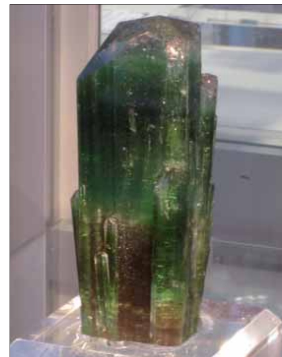
En praktfull Elbaitt var å finne i et av montrene til Rob Lavinsky og The Arkenstone.

Men det var da mineralene og fossilene vi var kommet for å se. Naturlig nok er det ikke bilder her av de små og sjeldne mineralene som noen av oss er opptatt av, men flere av de som var i München fikk med seg mang en sjeldenhet fra venner de møtte eller fra de ganske få utstillerne som står og selger systematisk. Mange