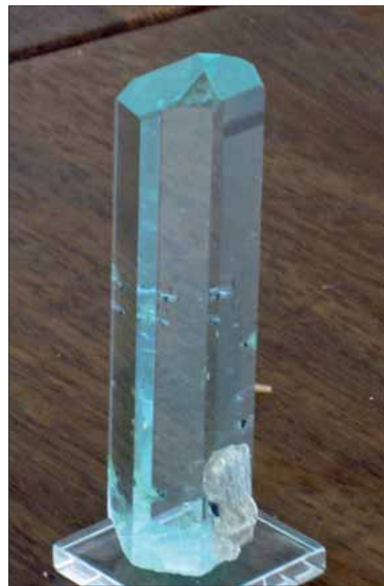
Denne fantastiske akvamarinen (8 cm høy) fra Shengus, Pakistan, er nå å finne hos en samler i Drammen.