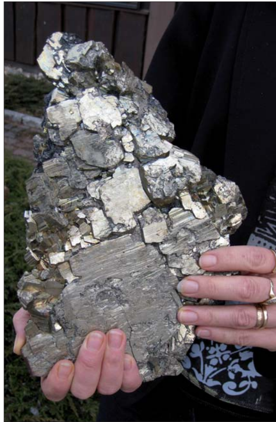
Pyritt, Storsynken, Knipane, 26 x 17 cm.