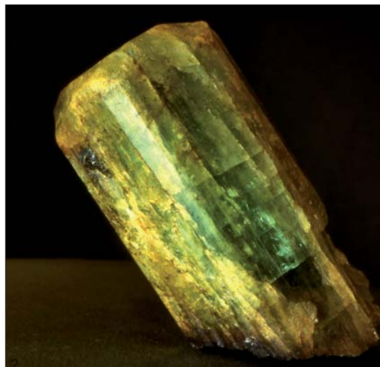
Beryll, Støledalen, høyde 7 cm.