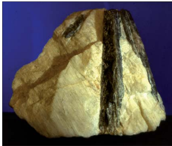
Thortveititt, Knipane, 6 cm lang xl.