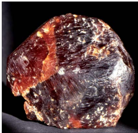
Spessartin, Birkeland gård, 7 x 5,5 cm.

I ettertid har samlingen blitt betydelig omarbeidet og utvidet. Den inneholder i dag bare mineraler fra Iveland/Evje-området og består av om lag 600 stuffer. Takket være god forståelse og velvilje fra politisk og administrativ ledelse i en årrekke, har utstillingen kvalitetsmessig blitt løftet opp på et solid kvalitetsmessig nivå.