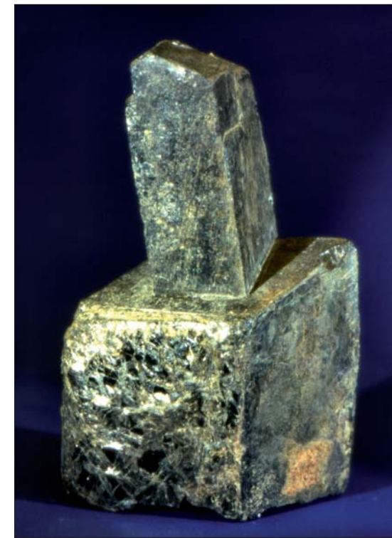
Aeschynitt, Mølland, høyde 7 cm.

Den nye utstillingen er ordnet etter emner som: Olaf Landsverk, pegmatitt, pegmatittens hovedmineraler (kvarts, feltspat og glimmer), thortveititt, beryll, pyritt, granat, de sorte mineralene og smykkesteiner. I tillegg finnes montre med andre mineralstuffer.