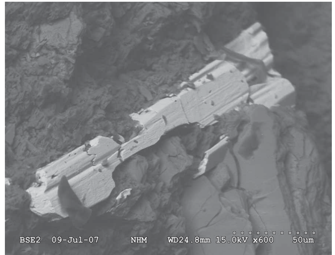
Figur 1: Så langt den mest komplette krystallen av heftetjernitt.

Ca_2(Fe^{3+})_3O_2(AsO_4)_3 \cdot 3H_2O En prøve med et sekundært belegg på arsenopyritt fra Langesundsfjorden