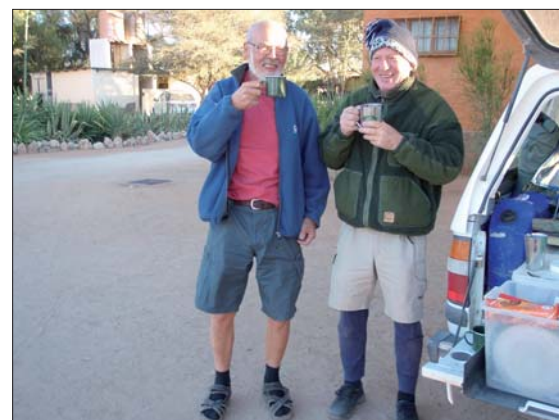
Gott varmt kaffe och en frusen svensk.