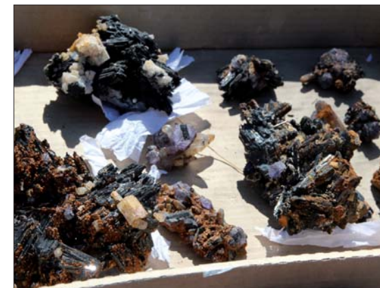
Fluorit- på turmalin och akvamarin kristaller.

På väg från Aussicht till Kamanjab i ren vildmark utan vägar - körde vi fast två gånger i torra floder. Vi löste det med att minska lufttrycket i bildäcken till 1,5 kg, varpå vi körde vilse. Det blev mycket sent på natten innan vi rejält skärrade kom fram till en normal grusväg. Det tog oss en hel vilodag för att komma i form igen och att få bort sand och damm ur bilarna.