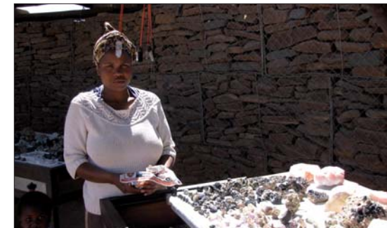
Köp mina kristaller!