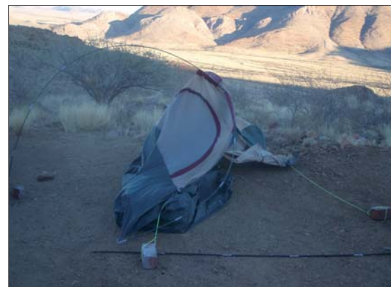
En stormig morgon.

Från S. till Walvis Bay och övernattnig i hamnstaden Swakopmund. Vi hade nu rest 200 mil och stora äventyret hade bara börjat. Denna helg besökte vi stadens mineralmuseum och några mineralbutiker och privata mineralsamlare.