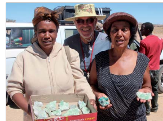
Köp av mej också!