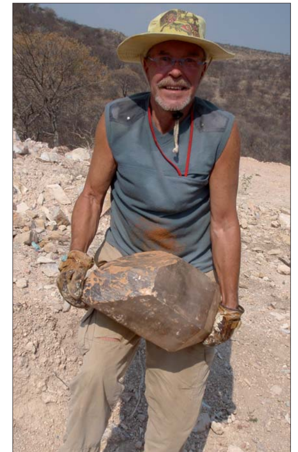
En lycklig kvarts samlare.

Söndag blev vilodag samt ompackning. Det blåste hårt och var snustorrt så vi var