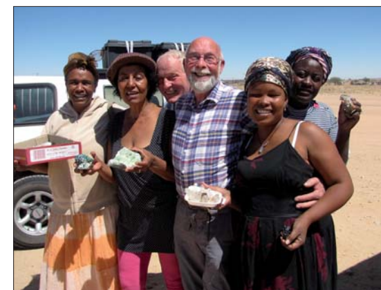
Vi fick bra kroppskontakt.

tysk familj handlade vi mängder av svart turmalin, fluorit och akvamarinkrystaller. Reste vidare till Rubicon Mine och letade efter röd turmalin och petalite varpå vi tog upp en äldre man som visade oss vägen hem till sitt skjul ute i vildmarken i Neu