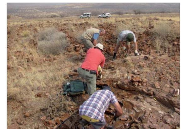
Zeoliter på gång.