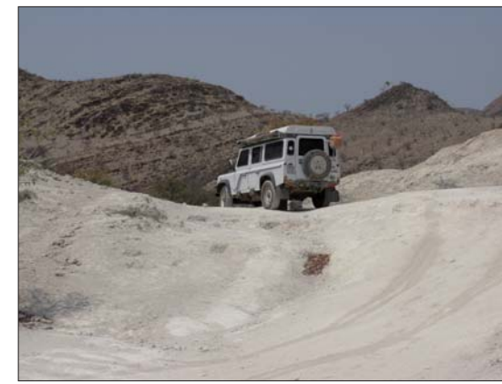
Klättrar över berg.