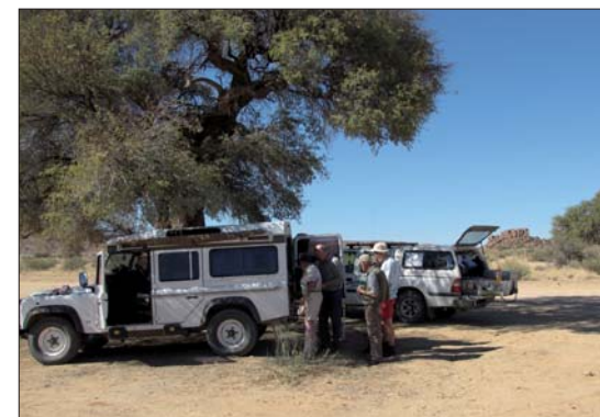
Skuggan var värdefull.

Vi tältade hälften av alla övernattningar. Övriga nätter tog vi in på camp sites eller