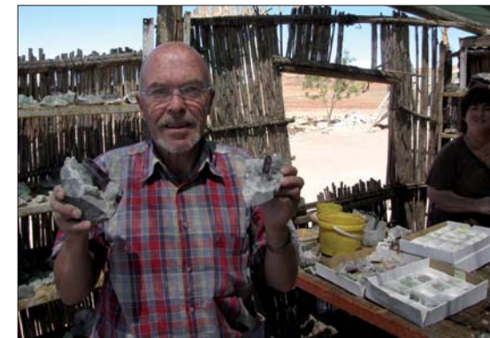
Underbara ametist kluster.