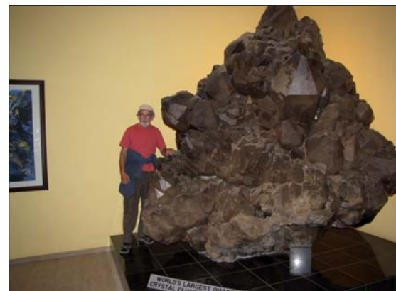
Världens största kvarts kluster.

Roessing Mountains passerade vi samt Kleine- och Grosse Spitzkoppe som numera är en Nationalpark. I Erongo Mountains fann vi topas- och amazonit kristaller samt en del stuffer med röda pyrop granater i Usakos. Vidare till Karibib. Där vi "överfölls" av lokalbefolkning som ville sälja sina kristaller.