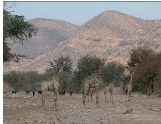
Giraffer mitt i vår väg/flod.

Från Windhoek till Rehoboth där vi letade Natrolit i närheten av Hardap Dam och vidare till Marienthal och övernattnig i Ketmanshop.