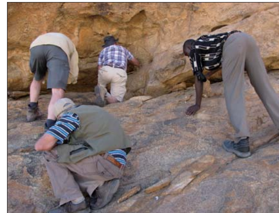
Här finns det fenakit kristaller.

Denna dag uppmätte vi resans varmaste dag med 43 grader i Omaruru. Vidare till