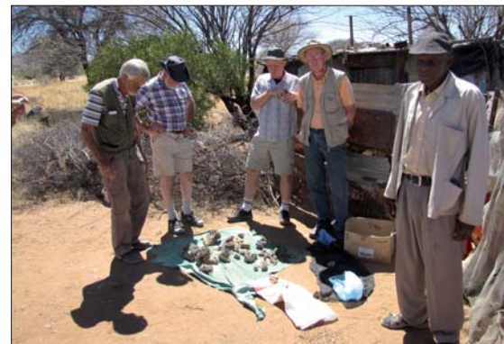
Många skeleton kvarts.

Handlade av Ross och hans fru och dotter samt fick sedan tillåtelse att plocka vad vi kunde finna i deras stora dagbrott och bakgård med underbara ametistkluster.