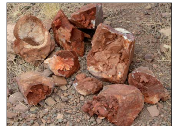
Natrolit och stilbit.