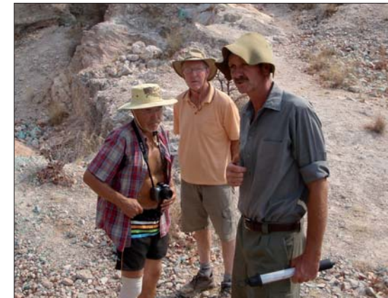
Dioplas-, shattukit- och plancheit.

Hemresa genom Syd Afrika, uppäckning samt besök hos Cape-Town Mineral Club.