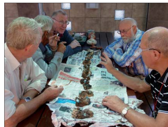
Akvamariner lottas ut.