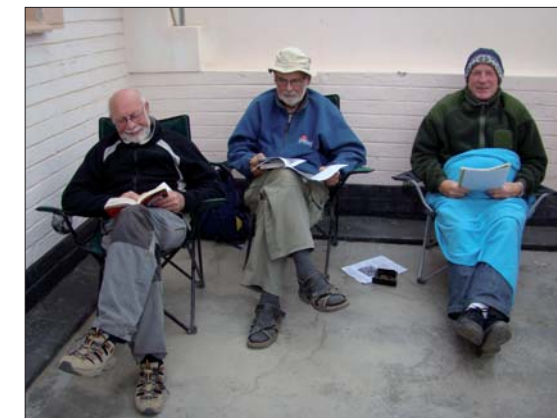
Ännu en kall afton.