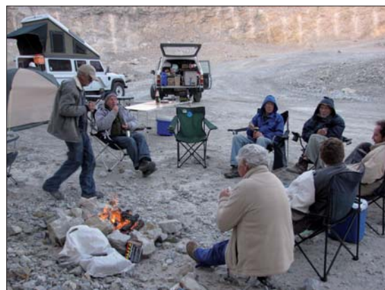
En kall kväll.