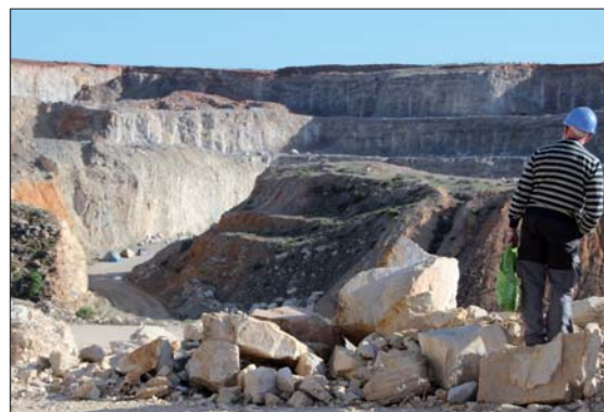
Våra tält i bakgrunden.