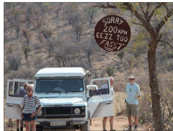
200 km/tim är inte tillåtet.