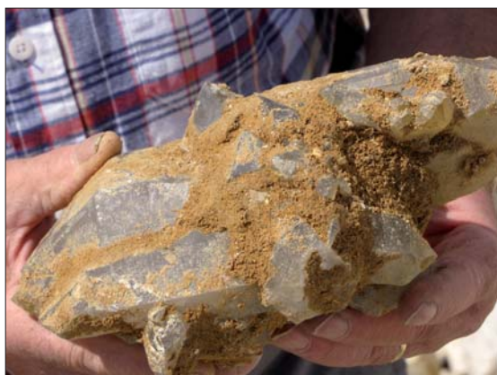
Stora och perfekta Floaters.