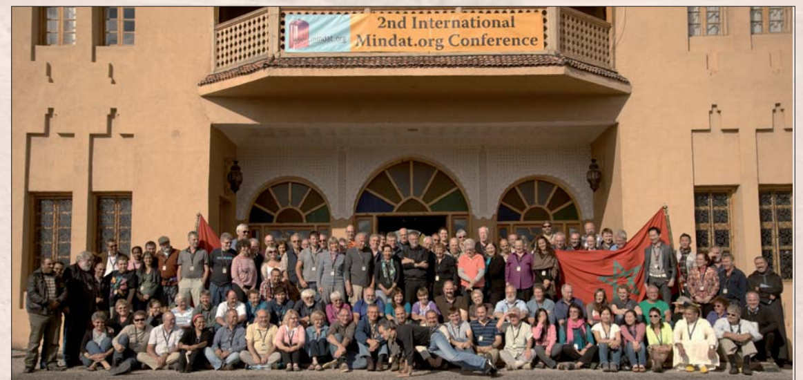
Her er alle deltakere som var med på denne 2. Mindat-konferansen samlet foran hotellet.