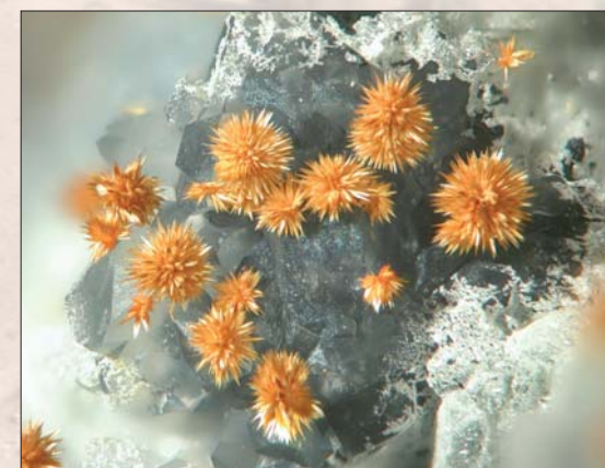
Karibibitt, Oumlil Est. Bildebredde: 3 mm. Samling: Georges Favreau.