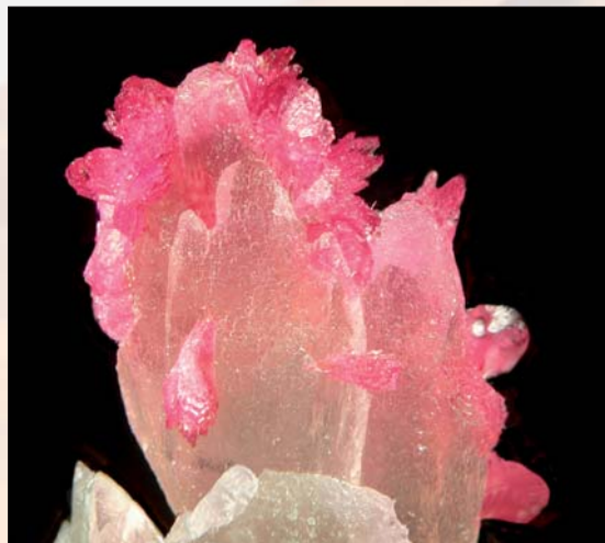
Roselitt, Bou Azzer. Bildebredde: 8 mm. Samling: Georges Favreau. Foto: Heinz-Dieter Müller.

Det får bli på neste tur, for allerede på dette tidspunkt var mange av oss enige om å vende tilbake til Marokko ved første anledning!