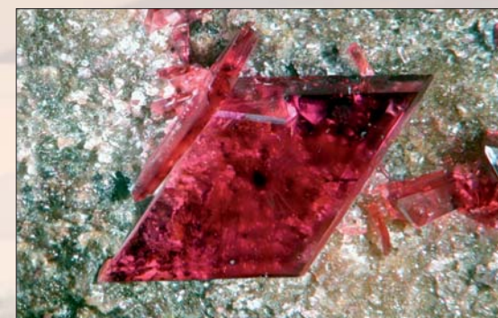
Erythritt, Bou Azzer. Bildebredde: 4 mm. Samling: Georges Favreau.

Neste stopp var tipphaugen til gruva i Ago-dal, der erythrin xx og karibibitt xx ble funnet, før siste stopp; Oumlil/Oumlil Est. Også her ble det gjort artige funn, og selvsagt er dette et område vi gjerne skulle brukt mye lenger tid i!