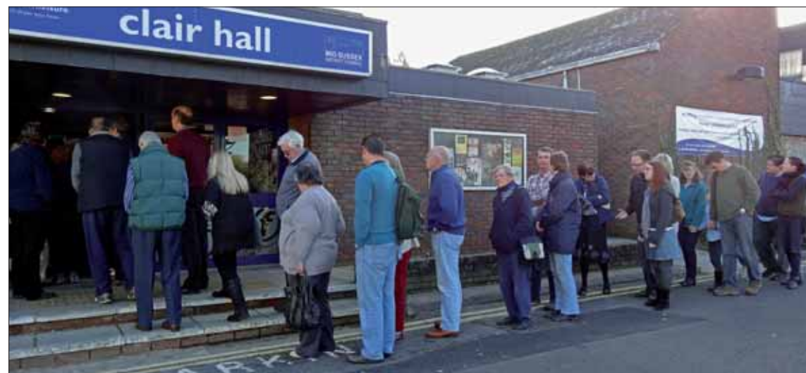
Lang kø når messa åpnet.

Det var et 50-talls utstillere, og tilbudet var variert. En av utstillerne hadde et stort utvalg av til dels gamle bøker og en annen hadde gamle lamper, snusbokser og annet gruverelatert, men selvsagt var det mineralhandlerne som dominerte. Prisnivået lå omtrent på internasjonalt nivå, men det