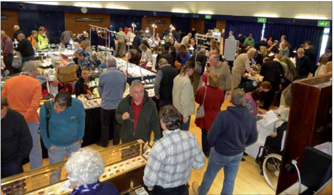
Det var folksomt i lokalet.

Skal du til London i midten av november er messa vel verd et besøk!