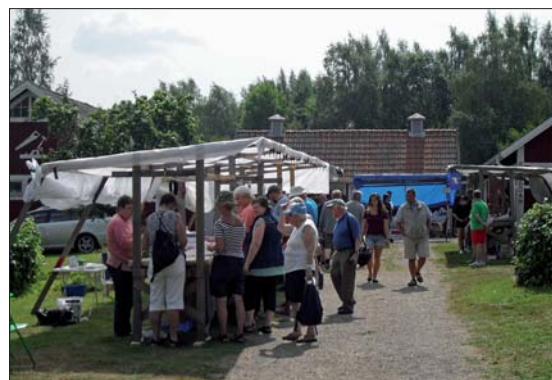
Smyckesdetaljer för egen tillverkning av smycken fanns också med på mässan.