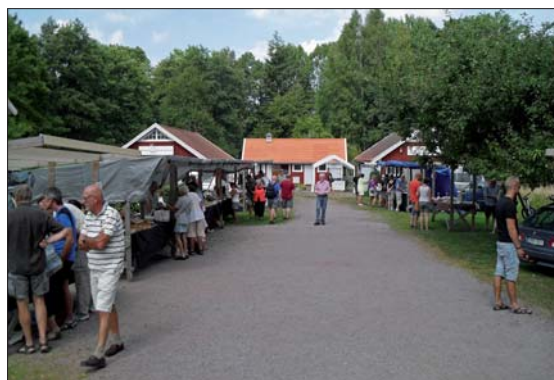
Längst ner på denna gata har Skarborgs geologiska sällskap ett fint litet museum.