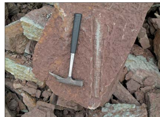
Ortocera t (Bläckfisk).