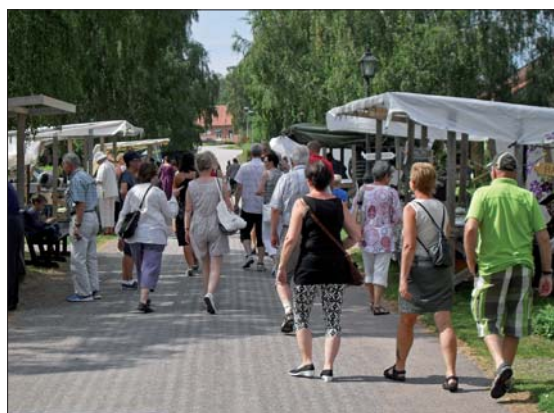
Vy över hantverksgatan där mässan hålls. På båda sidor av gatan kan man besöka olika slags hantverkare.