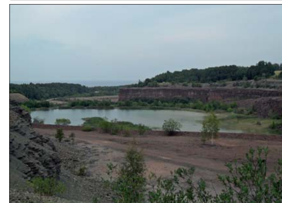
Cementas gamla kalkbrott .