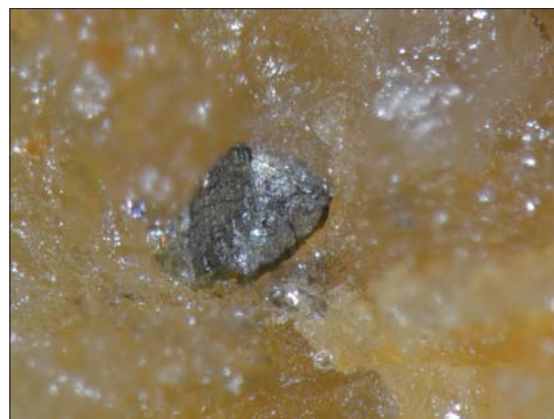
Fig. 2. Arsenkiskrystall i kvarts. Byrud, Minnesund, Eidsvoll, Akershus. Krystallen er ca. 0,5 mm stor.

Rundt forekomsten på Byrud er det alunskifer, og ifølge Neumann (1985, s.