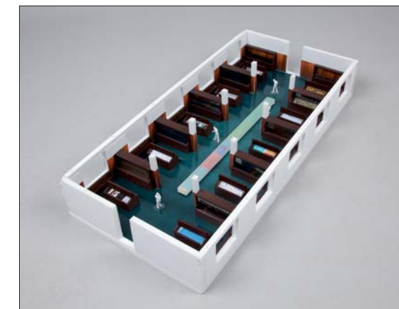
Modell av hvordan den nye mineral utstillingen vil bli. Modellen er laget av Atelier Brückner.

Det er nå bevilget penger via universitetet for at Naturhistorisk museum ved Brøggers -Geologisk skal renoveres og at det blir nye utstillinger. Hadde det vært mulig å ha åpne, fullverdige utstillinger for publikum mens samlingene flyttes, hadde vi selvsagt foretrukket det. Det er dessverre ikke mulig, men når de nye utstillingene åpner, vil NHM ha et geologisk publikumstilbud på høyt internasjonalt nivå.