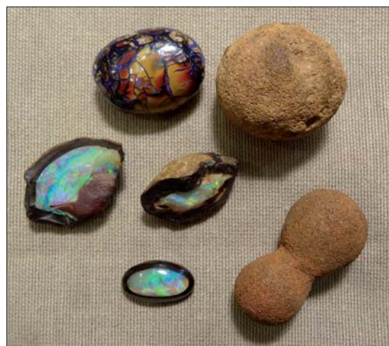
Yuwah-nut opaler fra Queensland, Australia.