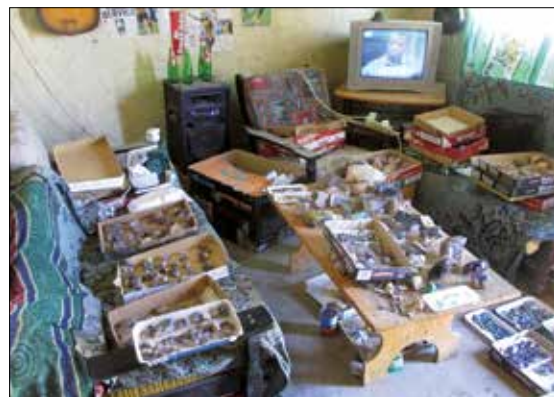
Hjemme hos ...