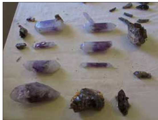
Inneholdet i en god druse.

utdannelse eller andre måter å forsørge selv på. Deres problem er ofte – som for oss alle som driver et lite firma – ikke det å produsere, men derimot å finne kunder for ens produkter. Det er der Geoloco kom inn i bildet.