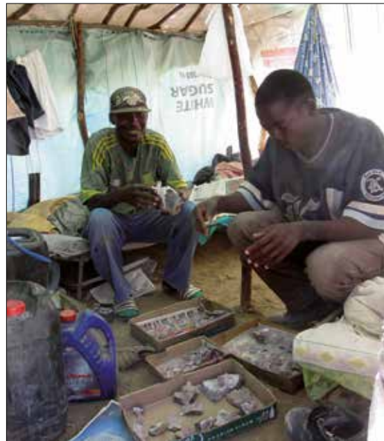
Small Scale Miners i Goboboseb med dagens fangst.