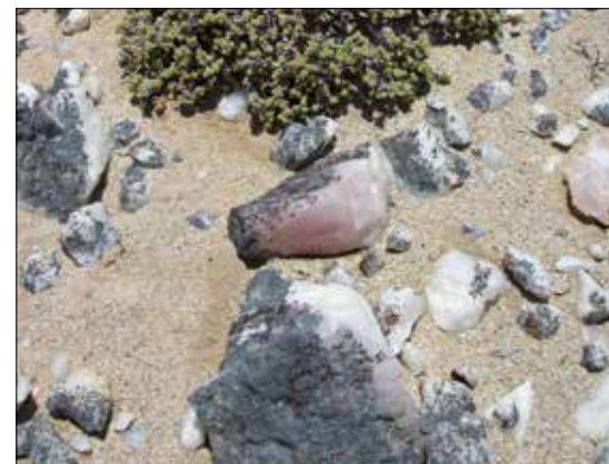
Rosenkvarts fremforvitret på bakken.