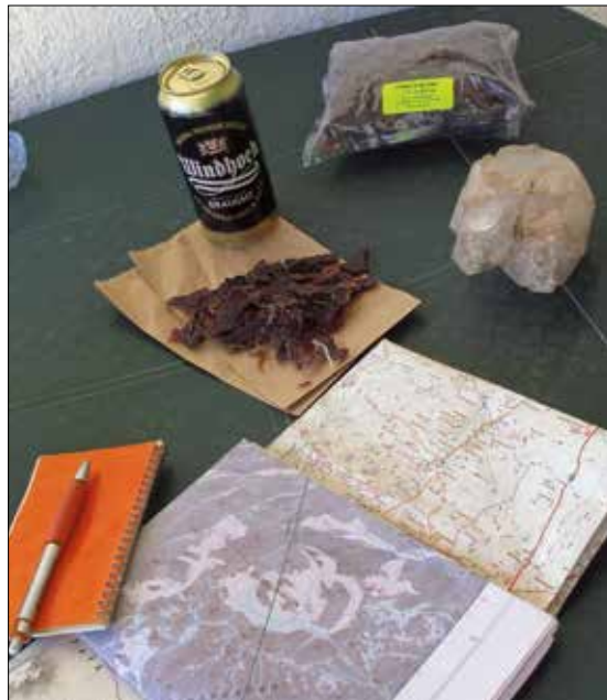
Perfekt lunch for en mineralhandler.

selvsagt er ens egne reiser som er de mest spennende! Vi nordboere som er vant til allemannsretten legger øyeblikkelig merke til alle gjerder og låste grunder der nede, man går ikke bare rett ut i naturen for å hverken ta bilder eller samle stein. Avtaler med grunneiere er nødvendige i store deler av landet, men der det ikke er privateid kan man bevege seg friere og oppleve en fantastisk natur med massevis av plass og utrolig mye vilt til tross for det tørre landskapet i Erongo. Og er man heldig får man testet medbrakt hammer