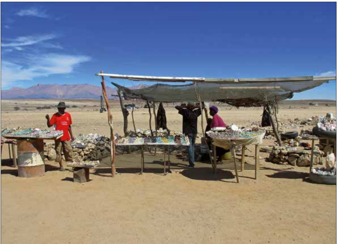
Lokale stenboder i Erongo.