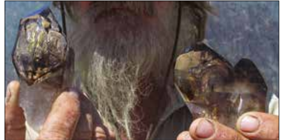
Dobbelterminerte røykkvartskrystaller med inneslutninger.

Produkter med sten fra namibianske SSM har kommet i salg hos Geolocos engroskunder, og mer skal det bli – så vi håper at alle involverte parter er fornøyde med denne satsningen!