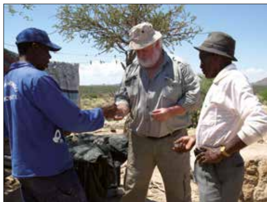
Seriøs diskusjon.