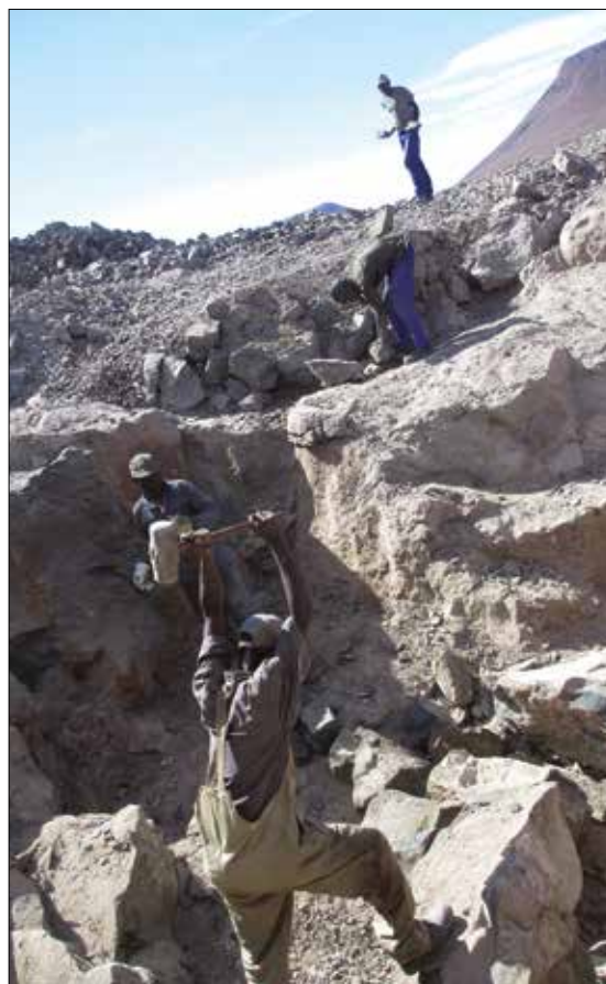
Arbeid i en ametyst-claim ved Goboboseb Mountains.

SGU forsøkte derfor å finne et grunnlag for samarbeide mellom disse SSM og det svenske stenmarkedet for på den måten å forbedre omsetningen og på den måten forbedre leveforhold for en stor gruppe mennesker som ikke har hverken