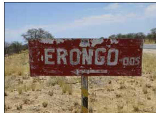
Ikke norsk skiltstandard.

Siden den reisen har det blitt flere, og den neste står like rundt hjørnet. Spennende å besøke disse miners både ute i felt og hjemme, man må også ta av sig hatten for deres resultater når man ser hvilke arbeidsforhold de ofte jobber under.