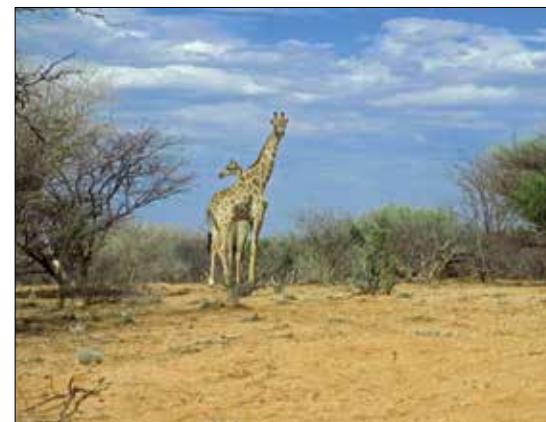
To flotte sjiraffer sett fra bilvinduet.

Økonomien hos disse miners er som regel relativt skrøpelig, men drømmen om den store drusen holder håpet oppe. Det er iallefall en stor glede å kunne hjelpe dem (og mitt eget firma) ved å kunne kjøpe det materialet som ikke så mange andre interesserer seg for. De beste stoffene får de bestandig solgt og ofte for gode penger. Som alle stensamlere har erfart hoper det seg fort opp stuffer som er ikke er så bra, men som er for gode til å kaste. Men det er nettopp B og C kvalitet som