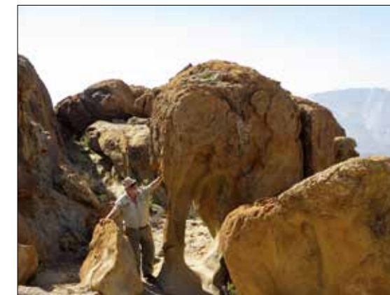
Granitt erodert som elefant i riktig størrelse.