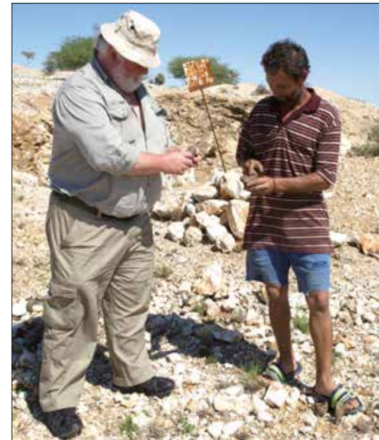
Claimholder ved purpurittgruven.

Inntil videre er det Erongo provinsen sentralt i landet jeg har konsentrert meg om, geologien der domineres av områder med granit og en mengde pegmatitter, samt et område med basalt. Pegmatittene har vært drevet på turmalin, røykkvarts, topas, akvamarin (de fantastiske stuffer man har sett kommer primært herfra) og