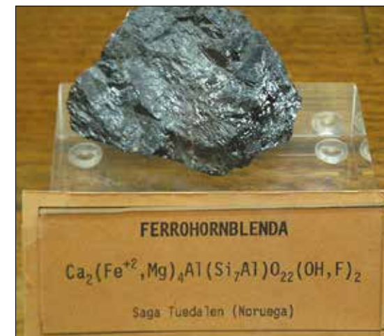
Amfibol ("ferrohornblenda") fra Saga, Mørje, Porsgrunn.