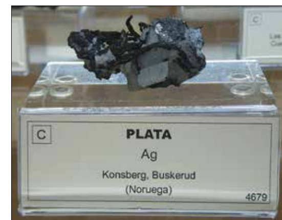
Sølv fra Kongsberg.