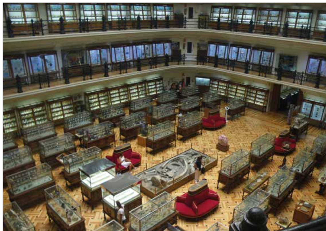
Mye å se på i Museo Geominero.

Det var godt at kameraet var fulladet den dagen, for dette ble en stor og hyggelig overraskelse på turen. Jeg kan anbefale alle som samler stein og som befinner seg i den spanske hovedstaden å ta en tur innom. Her følger et lite utvalg bilder fra museet [Museo Geominero i Calle de Ríos Rosas, red anm.].