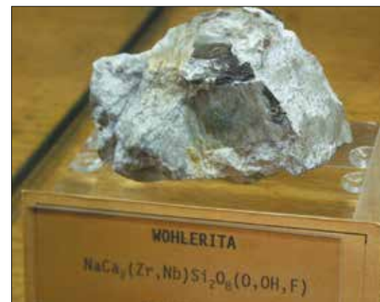
Gammel prøve med wöhleritt fra Langesundsfjorden.