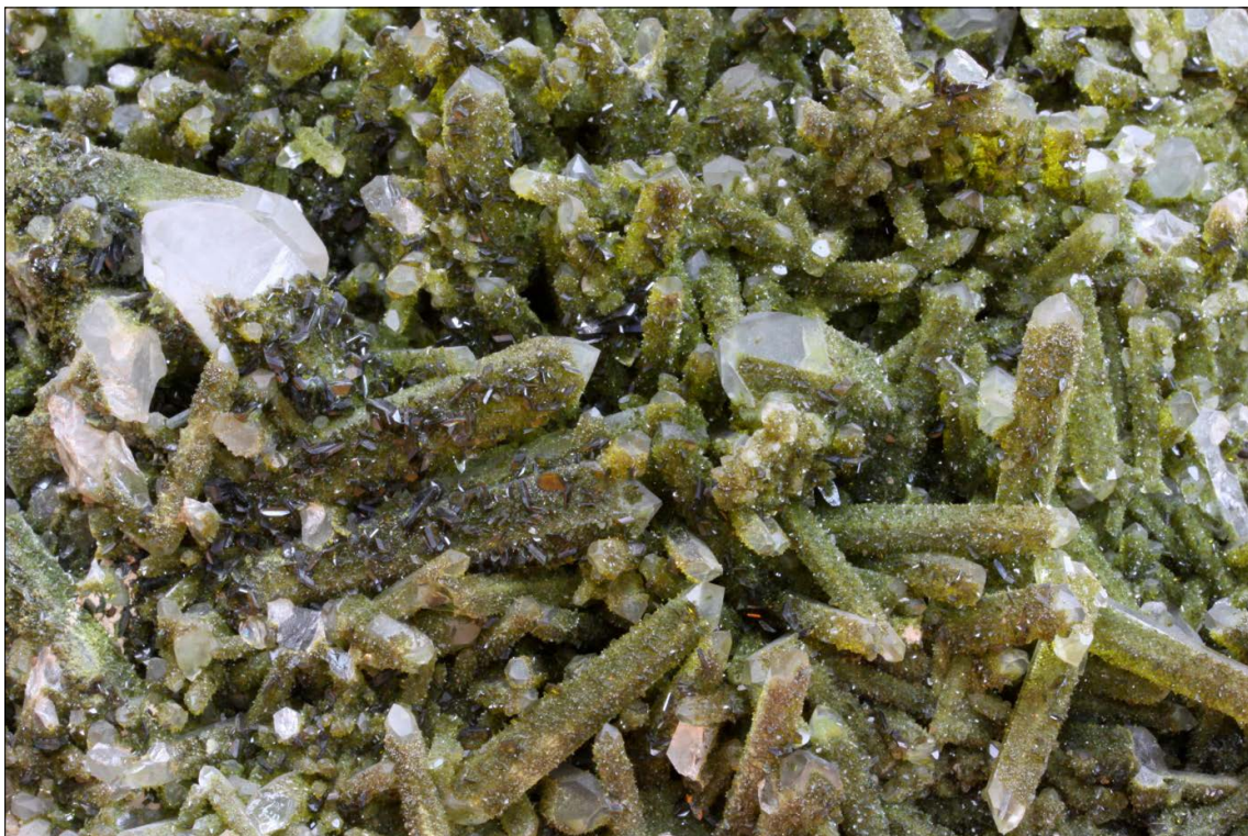
Epidot på kvarts.

Forekomsten var en sprekk ca. en meter på skrå mot høyre, 15 cm på det bredeste, fylt med noe som stakk og en sleip blågrå leire. Vi kunne skimte kvartskrystaller med grønn epidot. Her måtte det vaskes i masse vann, det var helt klart, og helst spyles. Leiren var av den helt seige sorten, og slapp ikke taket så lett. Etter å ha dradd ut noen flak (stuffer) slik at alle fikk noe hver, var det tid