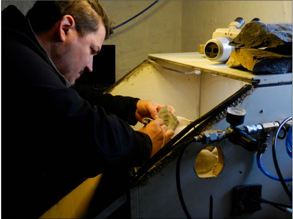
Proessen med preparasjonen krever tålmodighet.