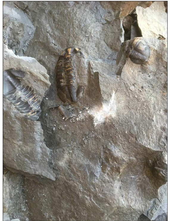
En Asaphus , der steinen har delt seg i en positiv og negativ del.

Trilobitt-jakt og preparasjon er en nydelig hobby samtidig som man får nyte naturen.