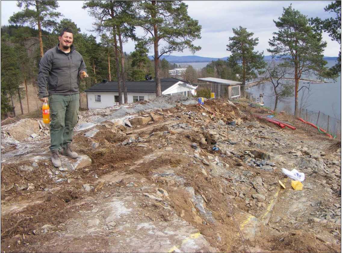
På jakt etter trilobitter i Hukformasjonen, Slemmestad.