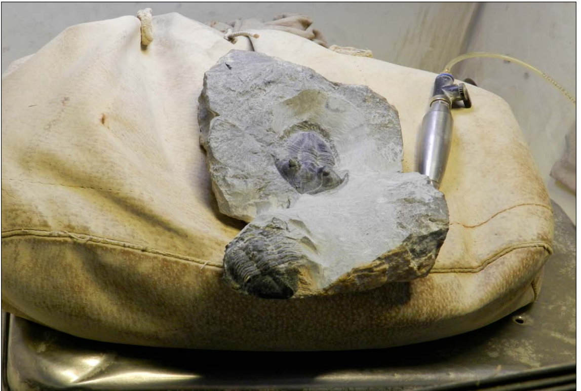
Med en veldig skarp ultralyd vil meisel fjerne den harde skorpen som omgir trilobitten.