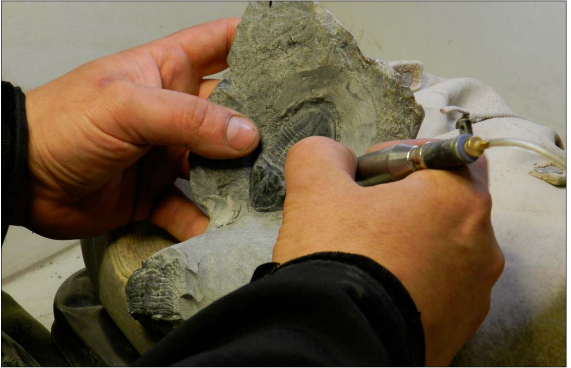
Maximo forbereder hver trilobitt fra 60 til 120 timer.