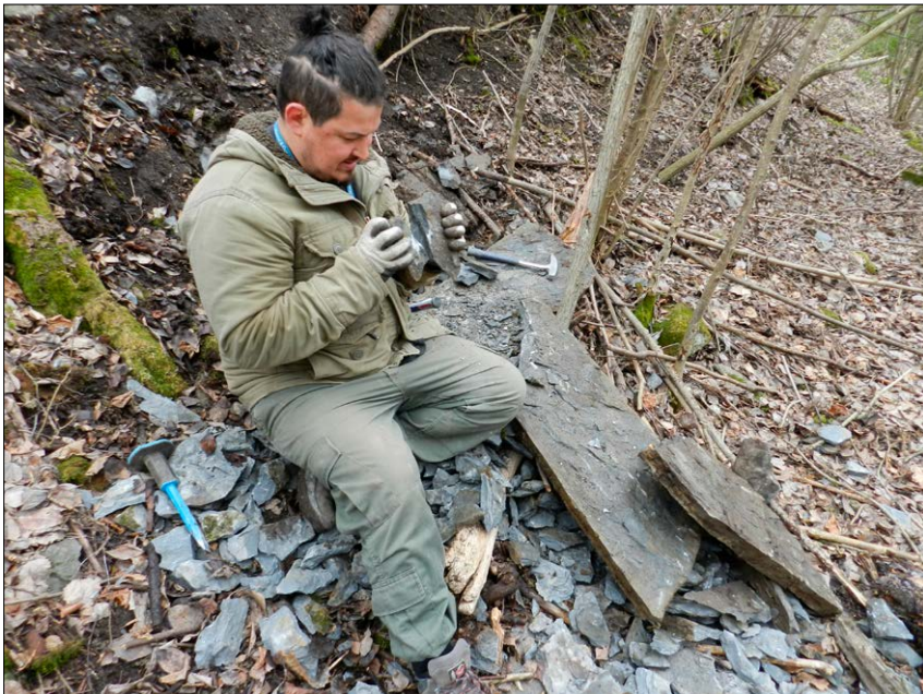
Vi skal få trilobittene ut av steinen. Hukformasjonen, Slemmestad.