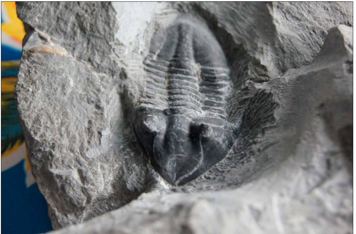
Halvveis i prepareringen av en Megistapis limbata fra mellom-ordovicium, fra Slemmestad.