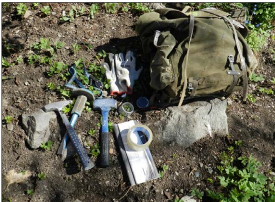
Utstyr som trengs til en trilobittjakt.

Laboratoriet må være utstyrt med luftavtrekk, et kabinet til steinen så du er