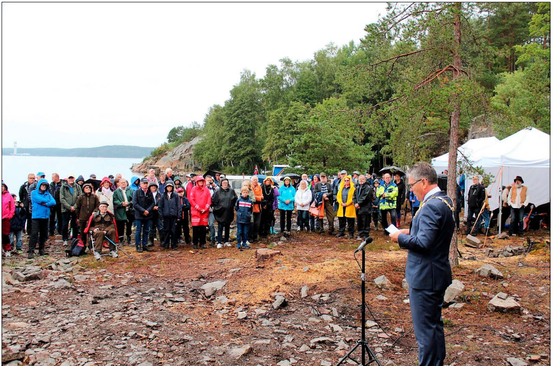
Det var folksomt på åpningen av «Monolittblokka».

Kanskje dette kan være til inspirasjon for andre historielag eller skoleklasser? Mange har noe spennende i sitt nærmiljø som kan være i ferd med å slukes av tidens tann eller av naturen. Finn et passende sted, og jeg vil garantere dere en spennende og meningsfylt oppgave!