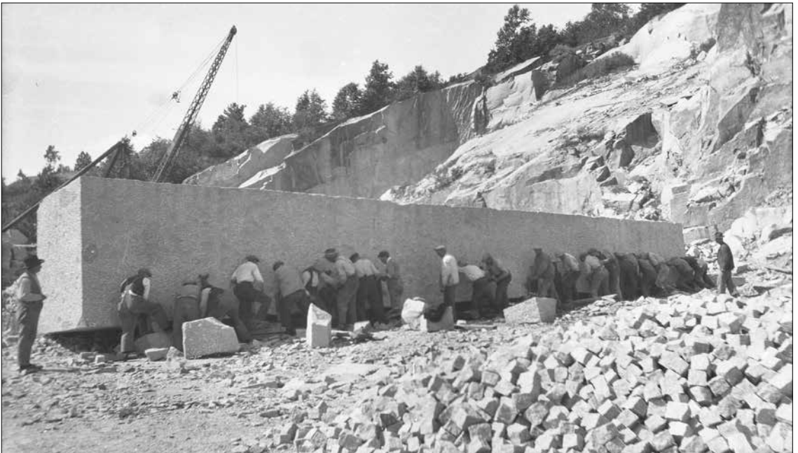
Blokka i Iddefjordsgranitt klargjøres for transporten i 1922.