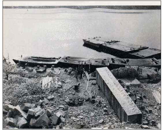
Blokka og lekterne.