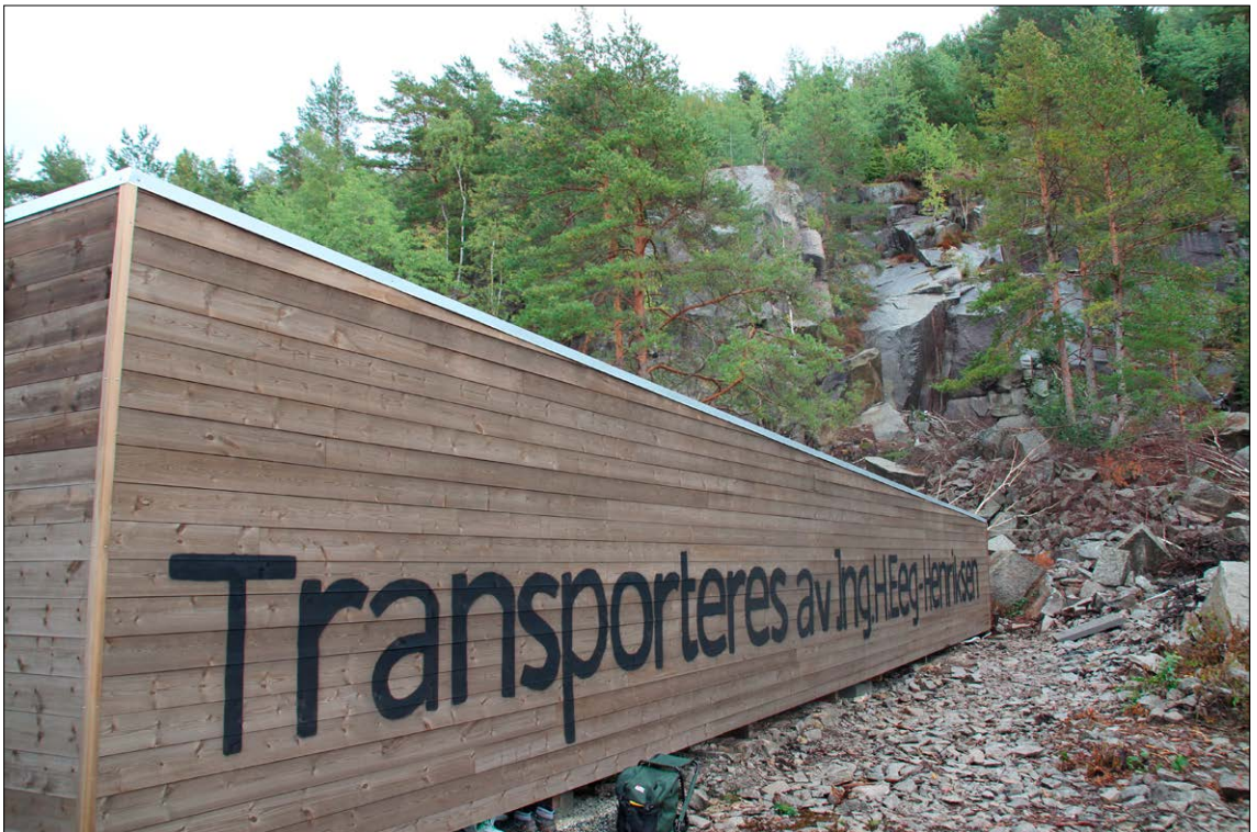
«Monolittblokka» – 2,5 x 2,5 x 17 meter – som viser historien.

I tillegg vil det komme opp en utstilling av verktøy og annet fra steinhogger-tiden, samt en geologisk utstilling som Østfold Geologiforening er behjelpelig med.