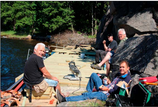
Arbeidsgjengen fra Idd og Enningdalen Historielag tar seg ei lita pause.