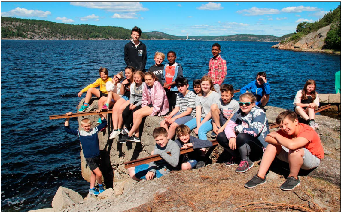
6. klasse ved Folkvang skole fotografert ved den gamle brygga etter jobben.